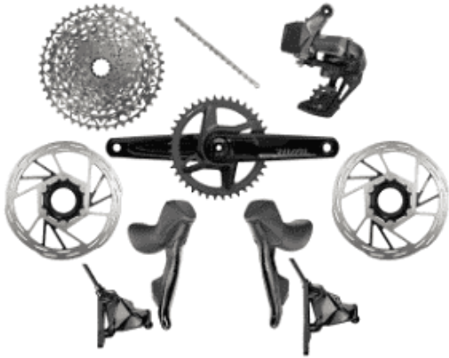
Groupe Sram Rival