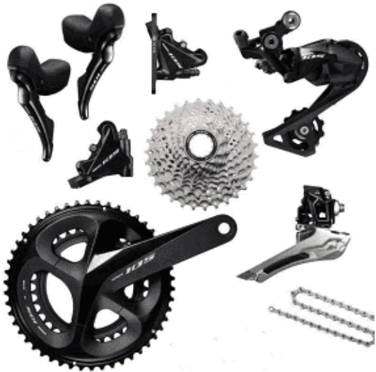
Groupe Shimano 105