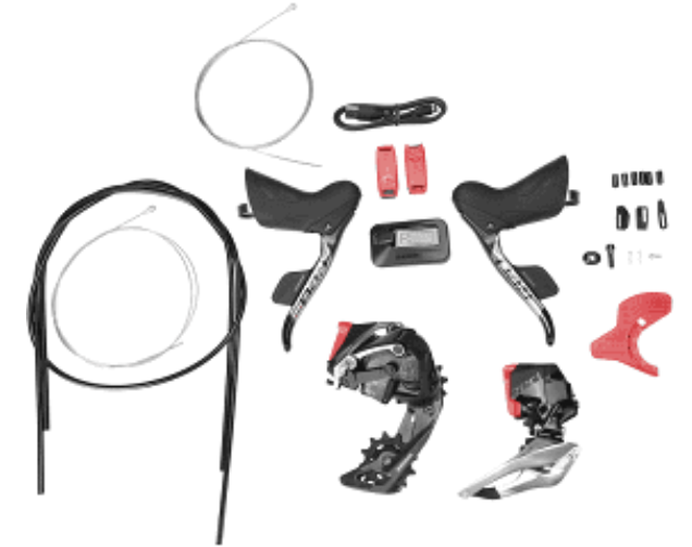
Groupe Sram Force CX1