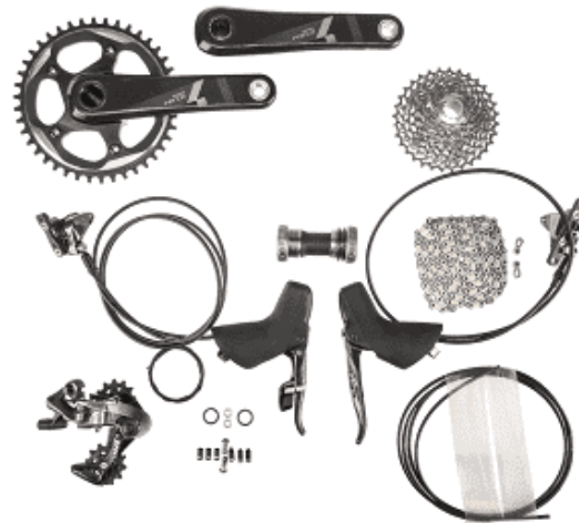
Groupe Sram Force