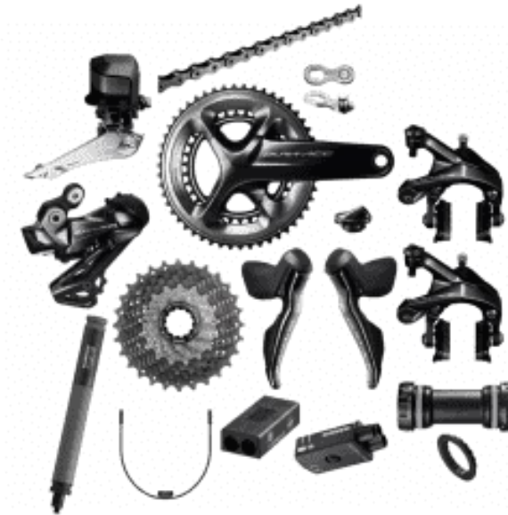
Groupe Shimano Dura-Ace