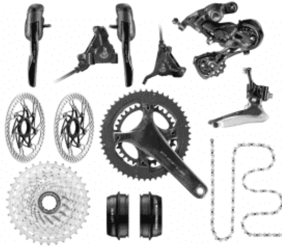
Groupe Campagnolo Chorus