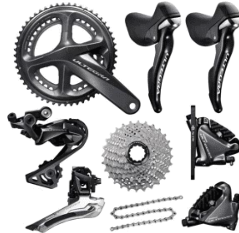
Groupe Shimano Ultegra