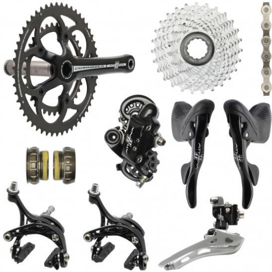
Groupe Campagnolo Athéna